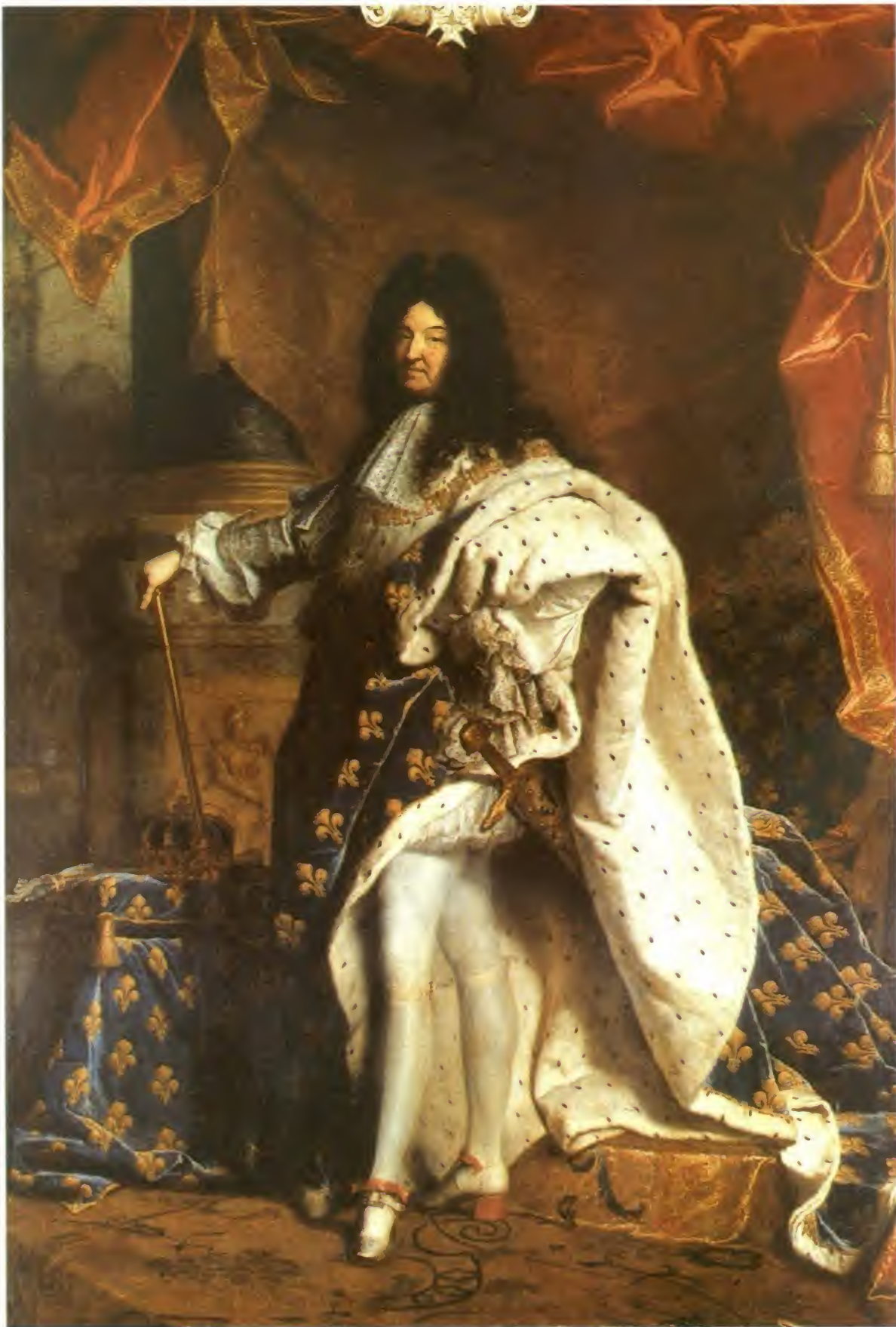
Luis XIV (retrato de 1701, por Rigaud, Museo del Louvre, París)